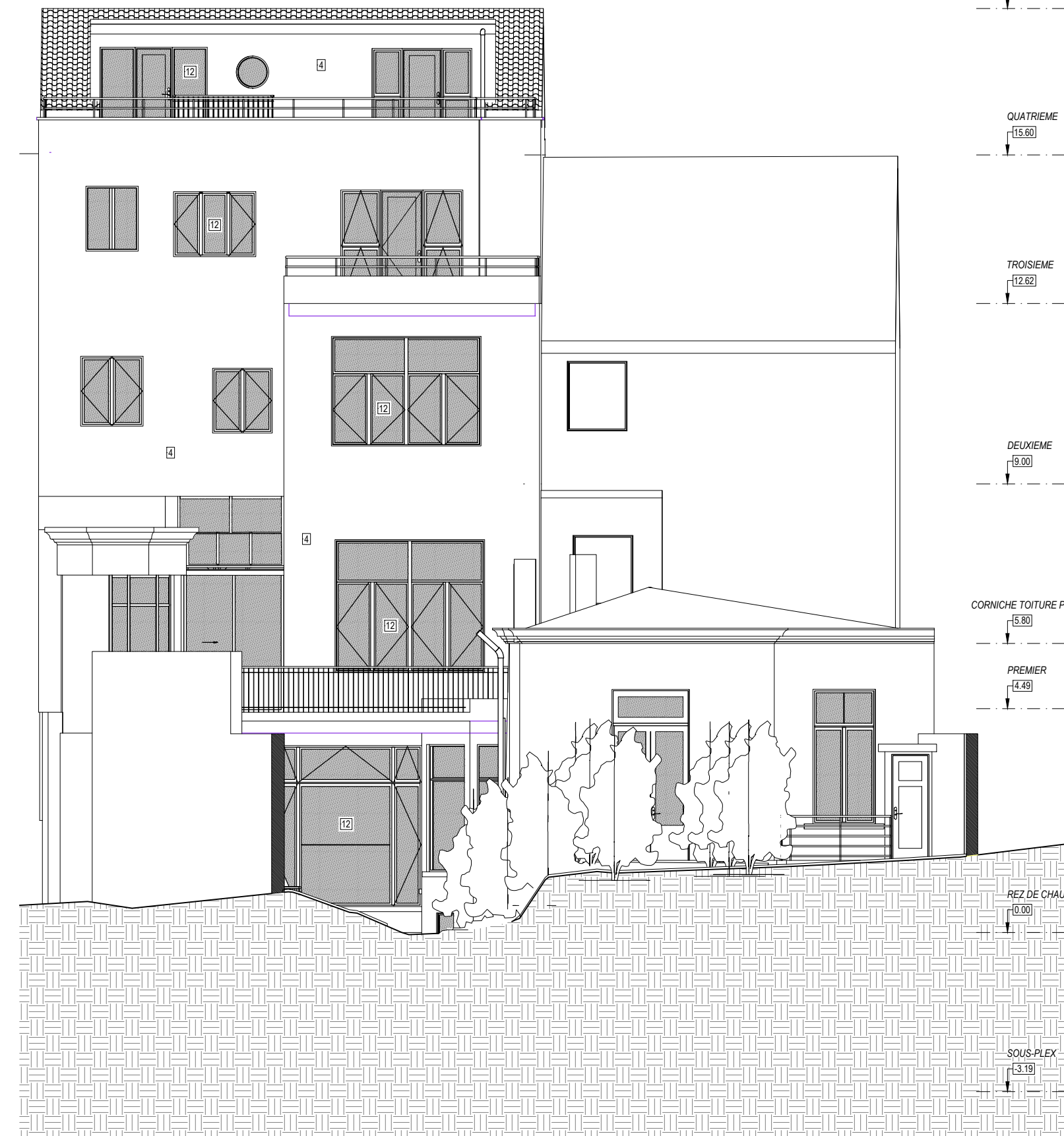
FACADE JARDIN A- 1/50