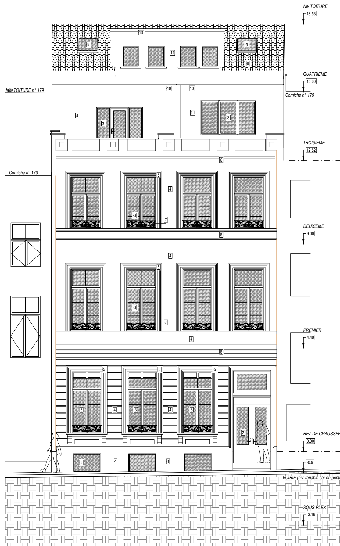
FACADE A RUE- 1/50